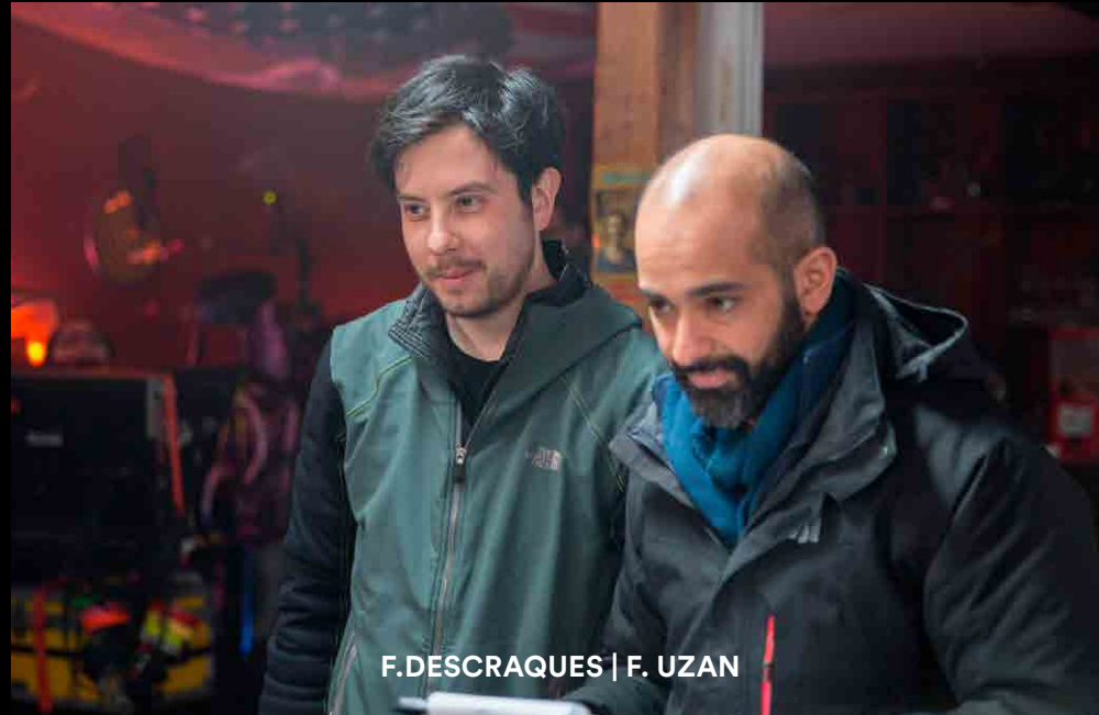
F.DESCRAQUES | F. UZAN