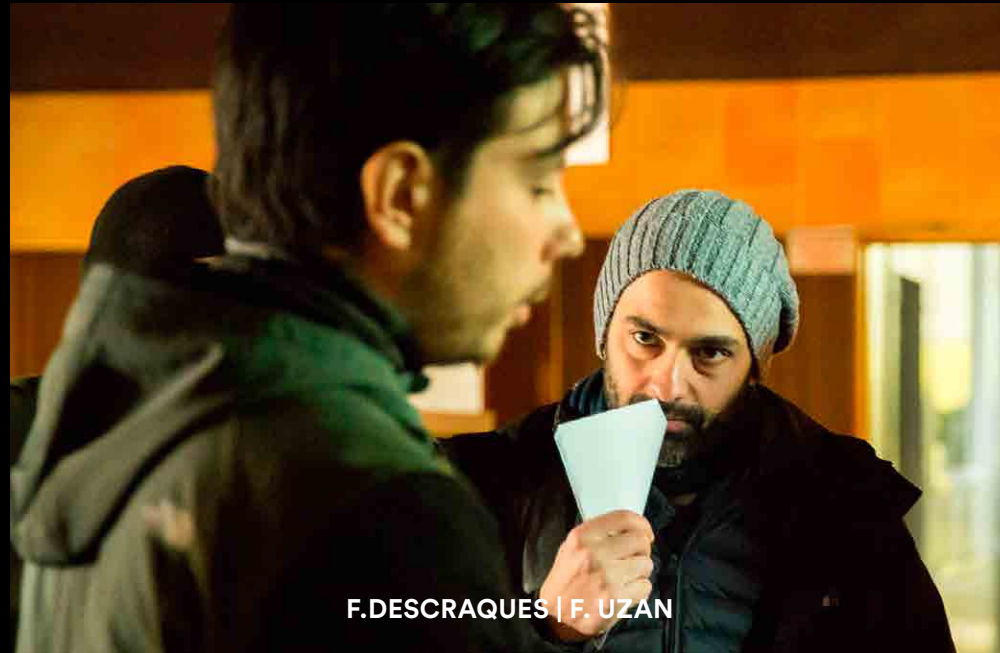
F.DESCRACQUES | F. UZAN