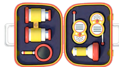
Son kit d'investigation