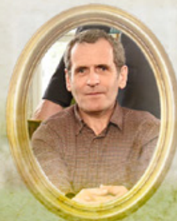
François-Henri de Lassay (Antoine Chappey)