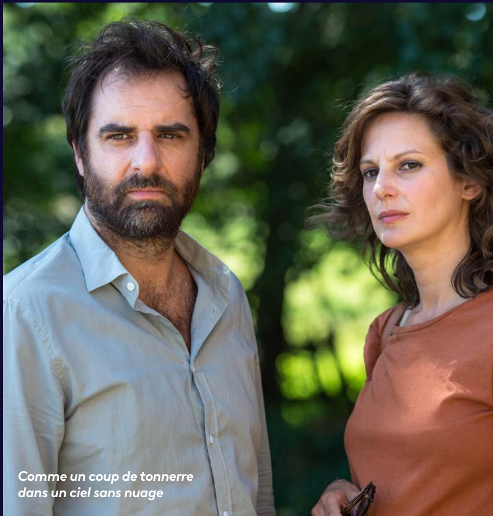
Comme un coup de tonnerre dans un ciel sans nuage