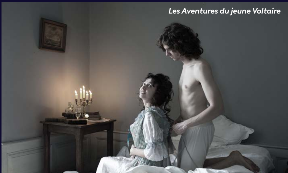
Les Aventures du jeune Voltaire