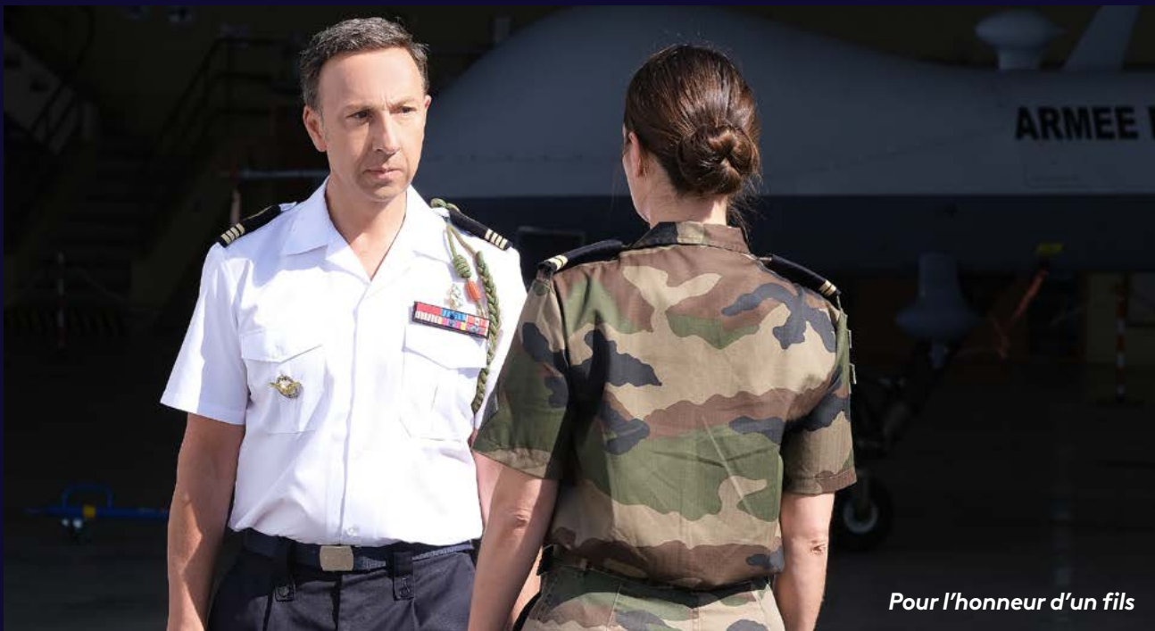
Pour l'honneur d'un fils