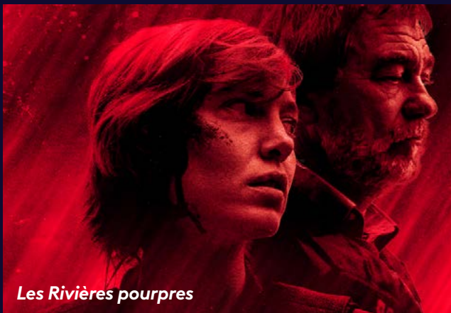
Les Rivières pourpres