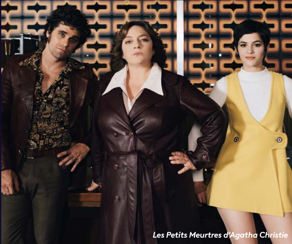
Les Petits Meurtres d'Agatha Christie