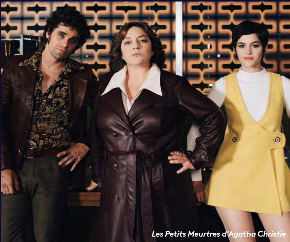
Les Petits Meurtres d'Agatha Christie