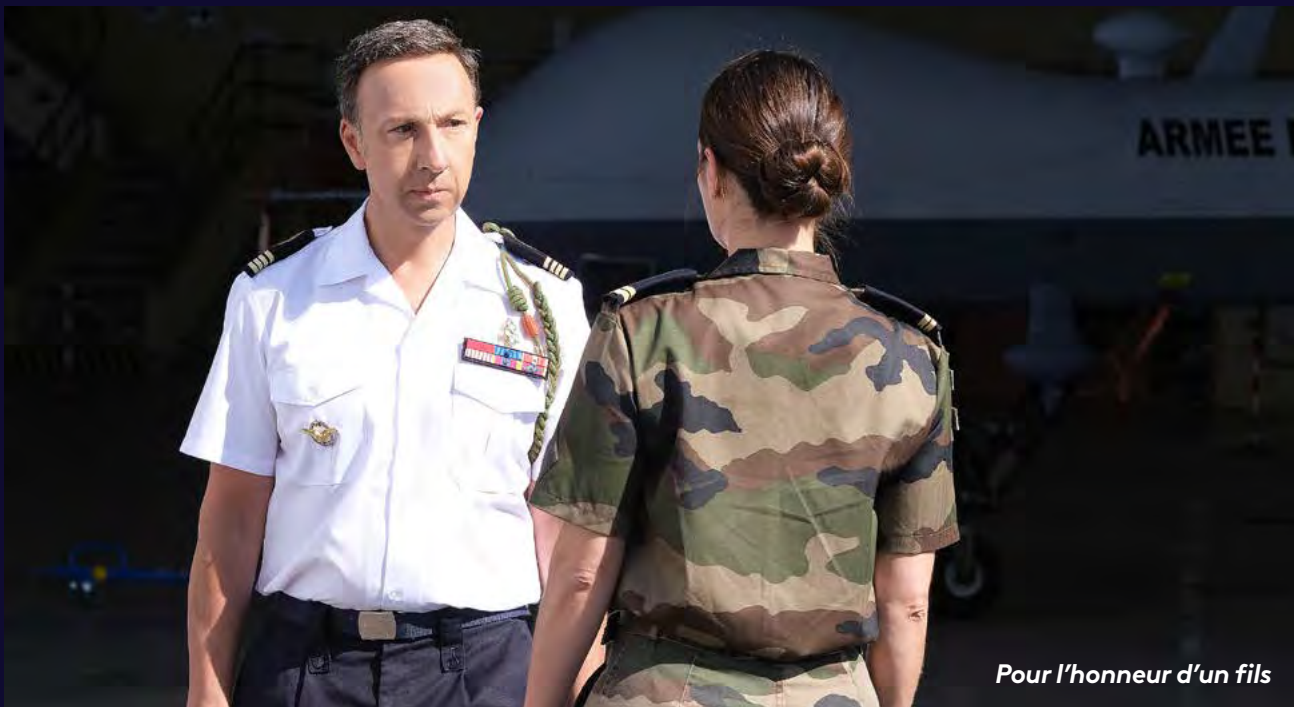
Pour l'honneur d'un fils