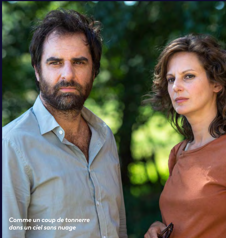
Comme un coup de tonnerre dans un ciel sans nuage