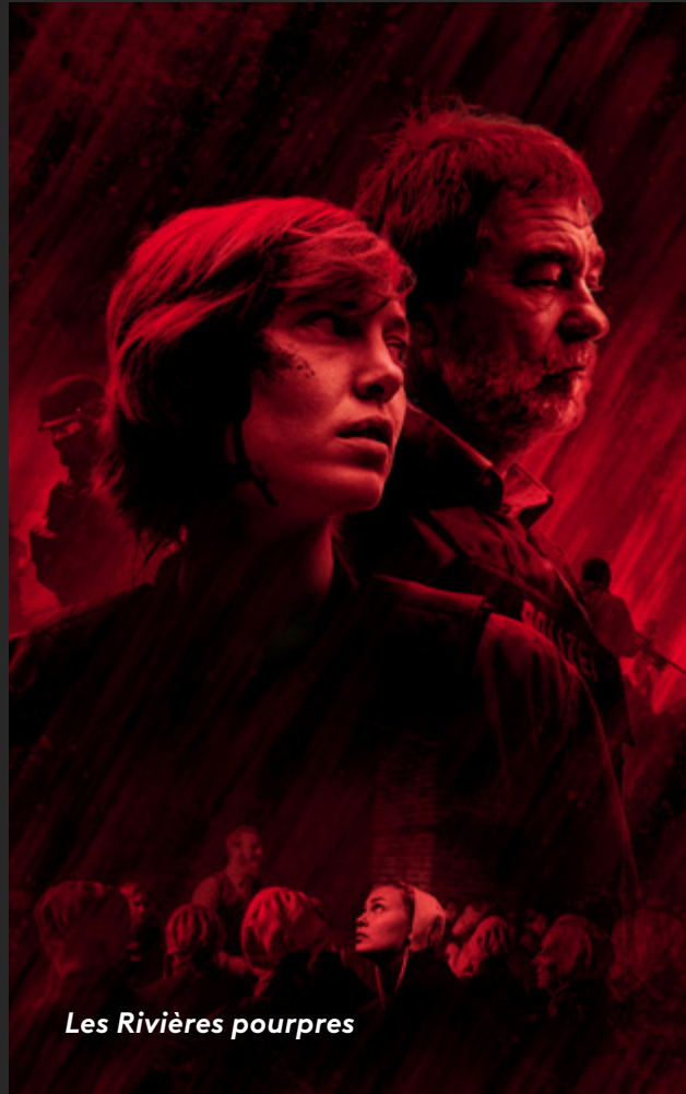
Les Rivières pourpres