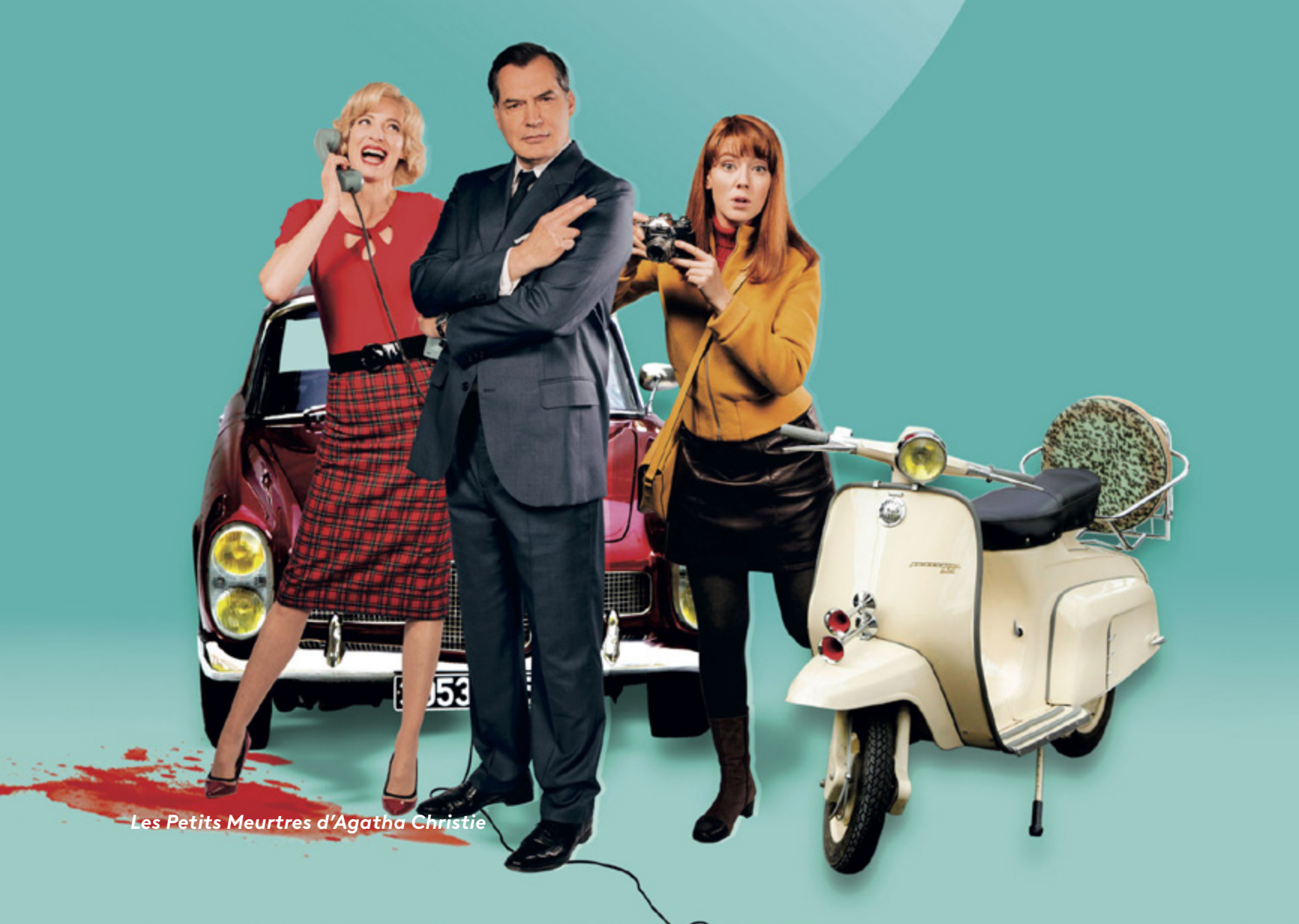
Les Petits Meurtres d'Agatha Christie