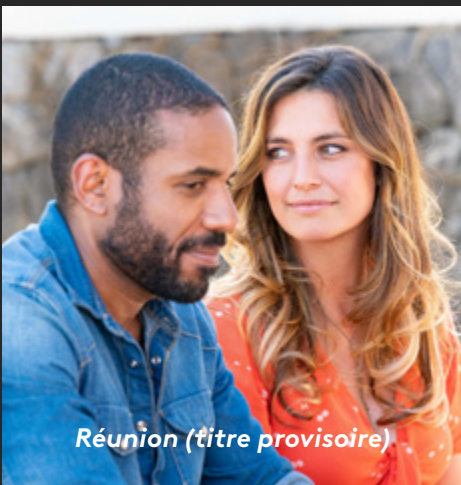
Réunion (titre provisoire)