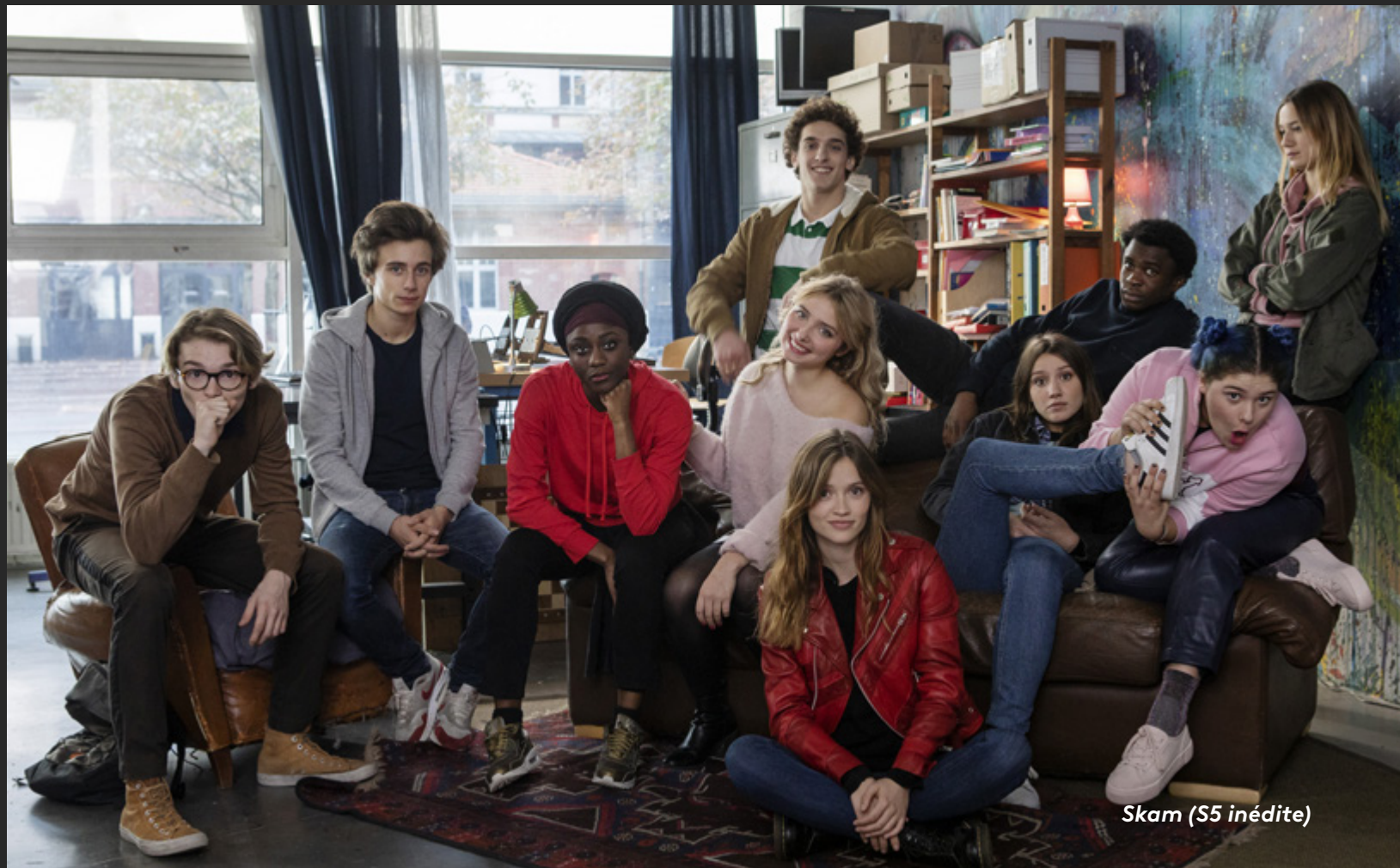
Skam (S5 inédite)