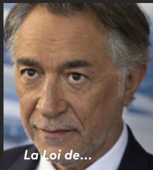
La Loi de...