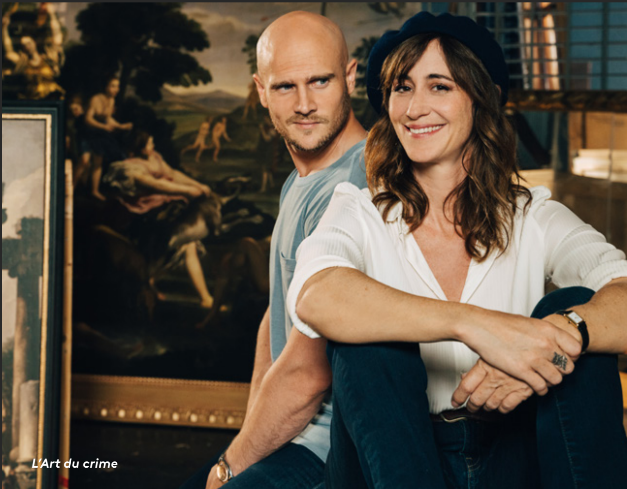
L'Art du crime