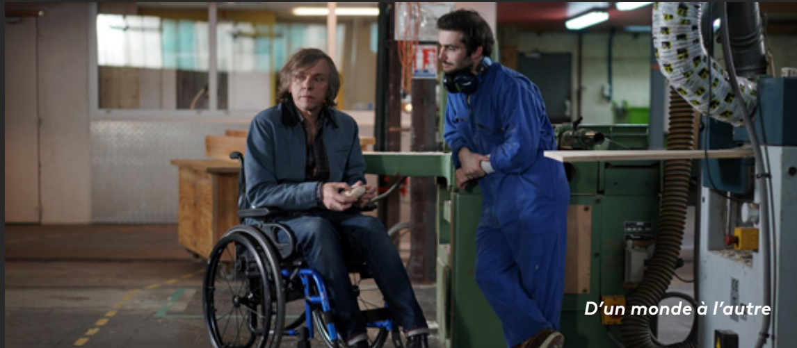
D'un monde à l'autre