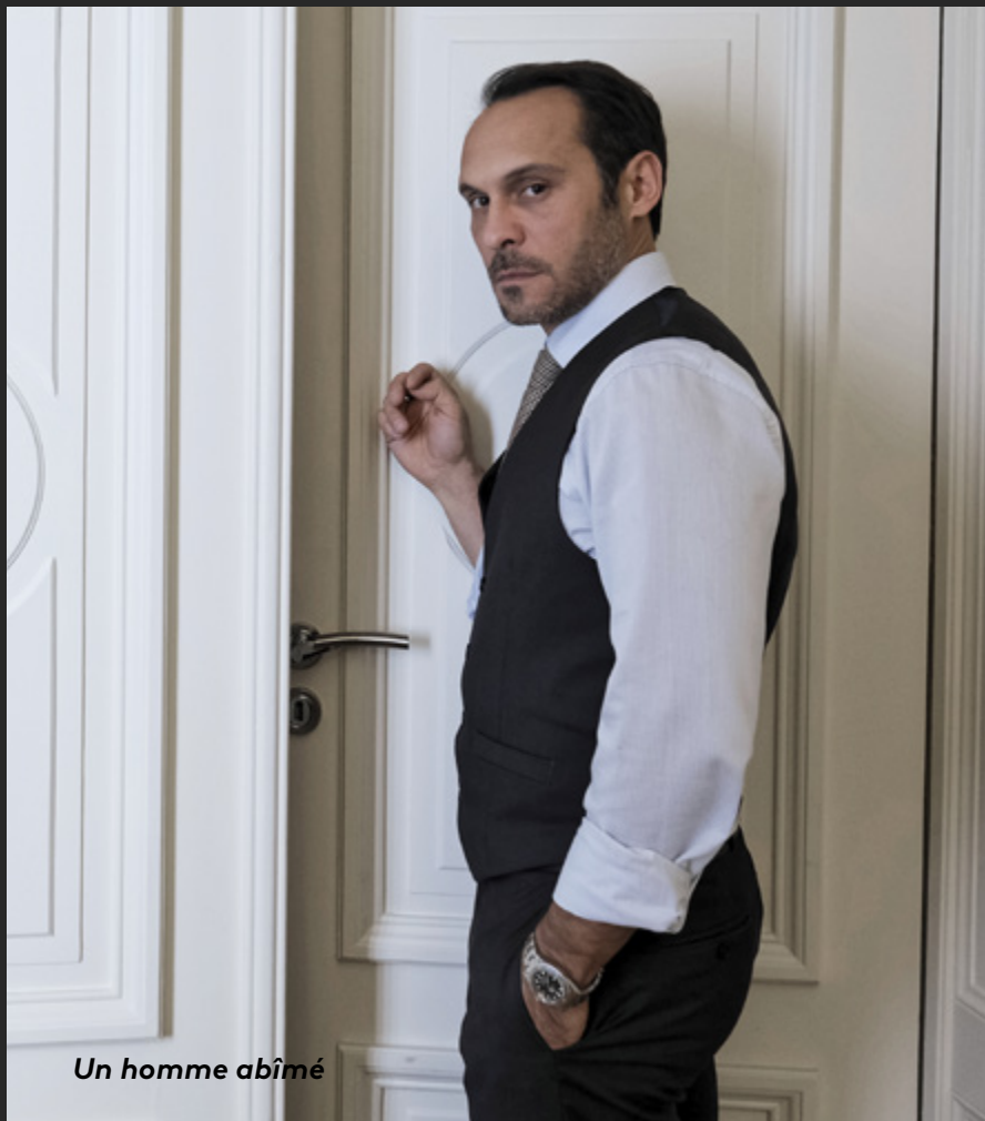
Un homme abîmé