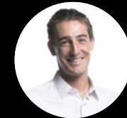
VINCENT JAY CONSULTANT BIATHLON MÉDAILLÉ D'OR ET DE BRONZE À VANCOUVER (2010)

Ma plus belle émotion reste le drapeau français qui monte dans le ciel de Vancouver avec La Marseillaise qui retentit. Sur cette course, je visais un Top 10. C'était un sentiment très fort car teinté d'incompréhension, de stress, de joie et de fierté. Les larmes sont venues très vite.