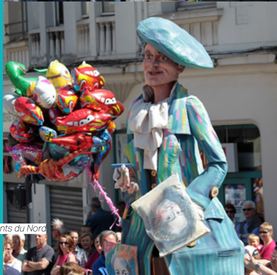
Les géants du Nord