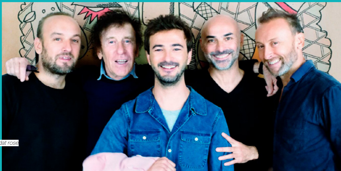
Le Soldat rose