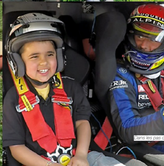
Dans les pas d'Apollo