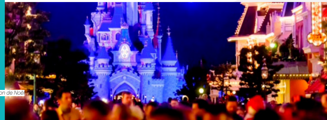
La chanson de Noël