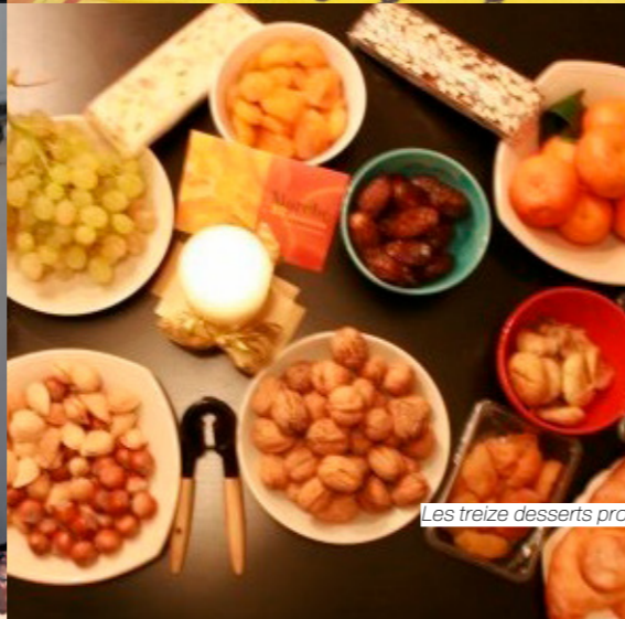
Les treize desserts provençaux