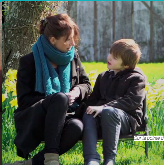
Sur la pointe des pieds