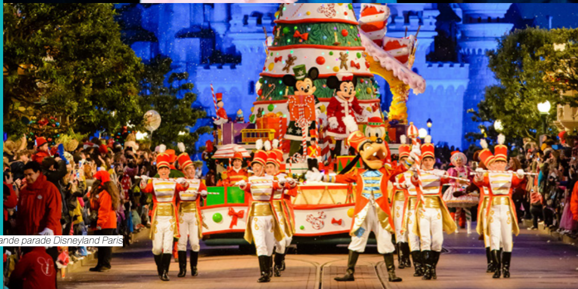
La Grande parade Disneyland Paris