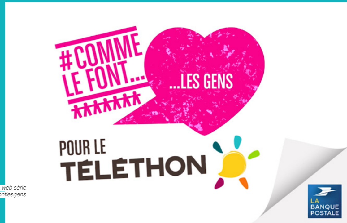
La web série #commelefontlesgens

Comme chaque année, les célébrités présentes sur le plateau offriront des lots personnels aux téléspectateurs et internautes du Téléthon. Une rencontre, un vêtement, un séjour ! Vous pourrez également enchérir sur des œuvres d'artistes contemporains comme les célèbres animaux de Richard Orlinski ou les toiles Kinetic Pop Art de Patrick Rubinstein. La vente aura donc lieu sur le site www.drouotonline.com du vendredi 8 décembre au dimanche 10 décembre.