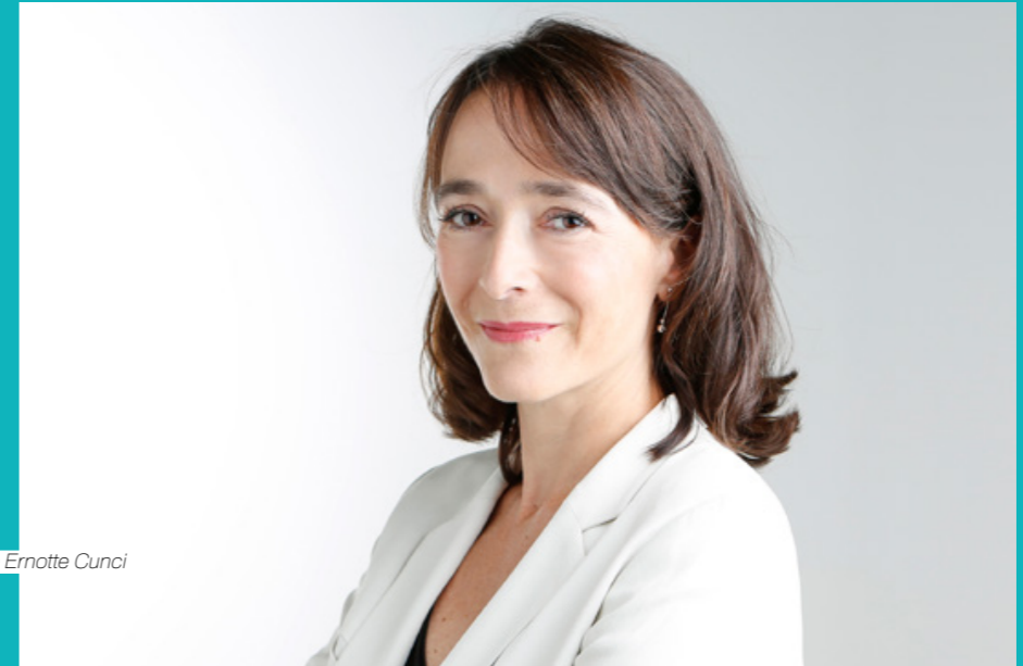
Delphine Ernotte Cunci

Delphine Ernotte Cunci Présidente-directrice générale de France Télévisions