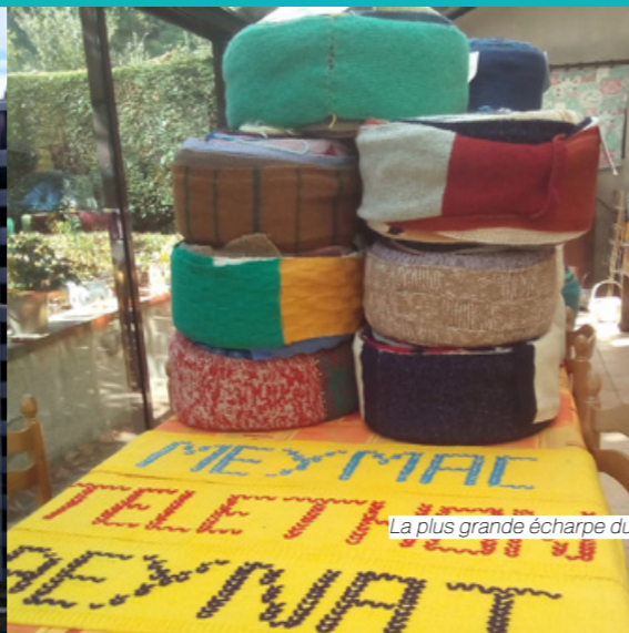
La plus grande écharpe du monde