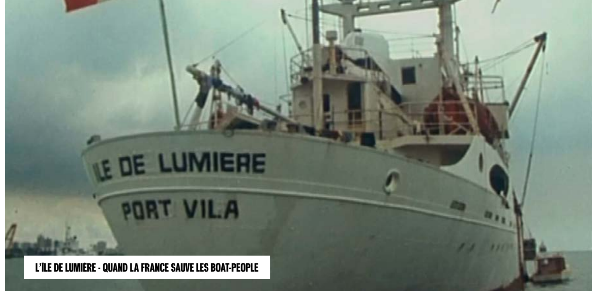
L'ÎLE DE LUMIERE - QUAND LA FRANCE SAUVE LES BOAT-PEOPLE