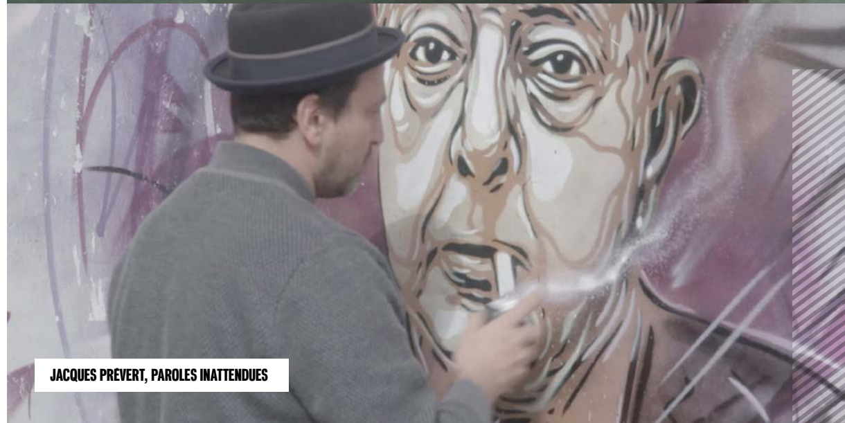
JACQUES PRÉVERT, PAROLES INATTENDUES