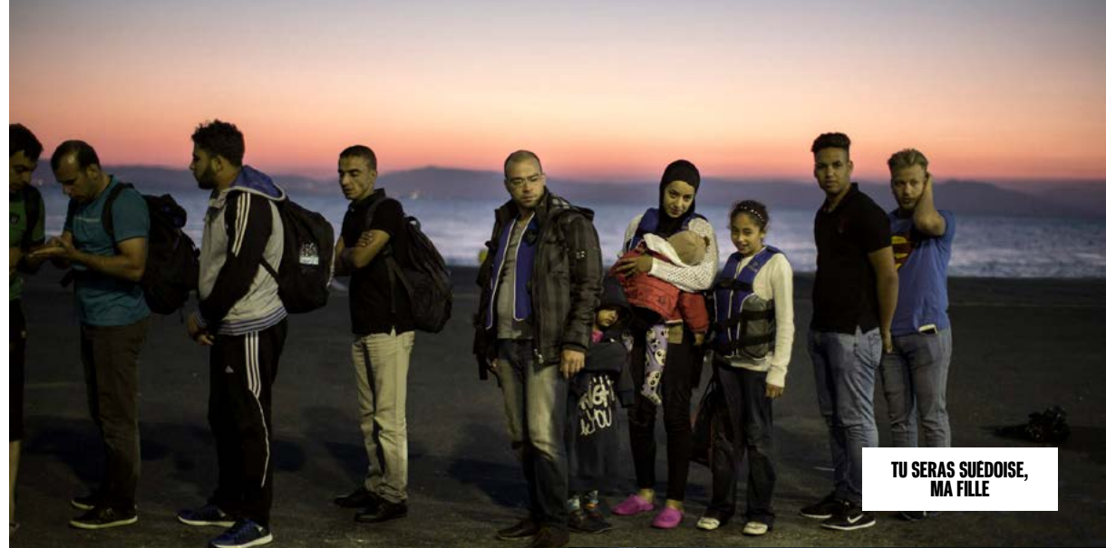
TU SERAS SUEDOISE, MA FILLE

Réalisation : Anna Zamecka Production : Otter Films et Wajda Studio