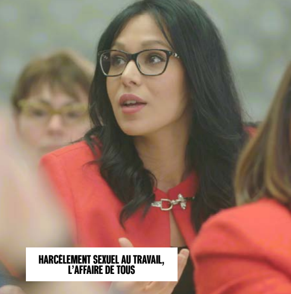
HARCELEMENT SEXUEL AU TRAVAIL, L'AFFAIRE DE TOUS