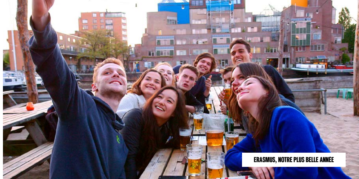
ERASMUS, NOTRE PLUS BELLE ANNÉE

Réalisation : Cécile Denjean Production : Scientifilms