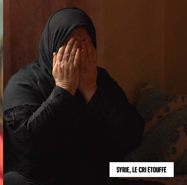
SYRIE, LE CRI ÉTOUFFÉ