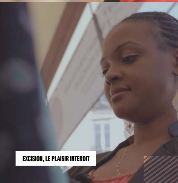
EXCISION, LE PLAISIR INTERDIT