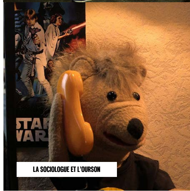
LA SOCIOLOGUE ET L'OURSON