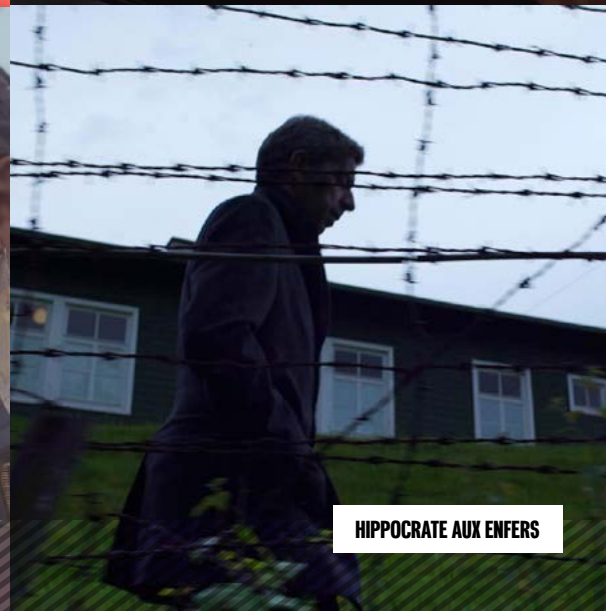
HIPPOCRATE AUX ENFERS