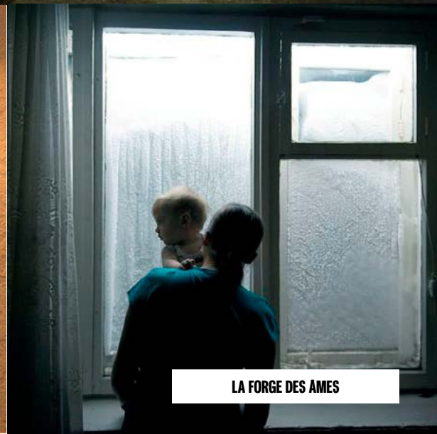
LA FORGE DES AMES