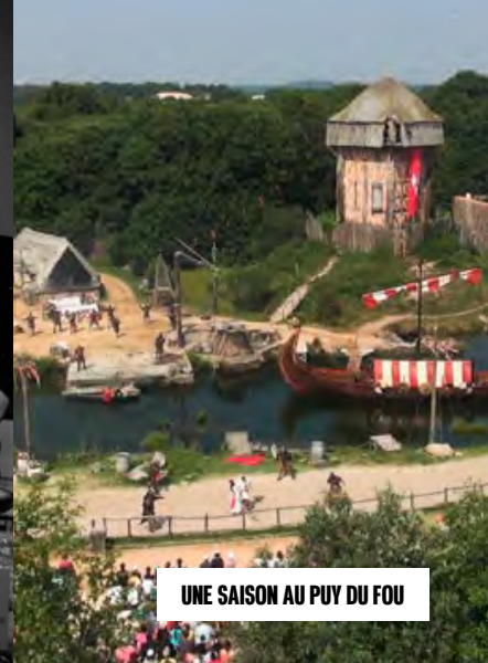
UNE SAISON AU PUY DU FOU