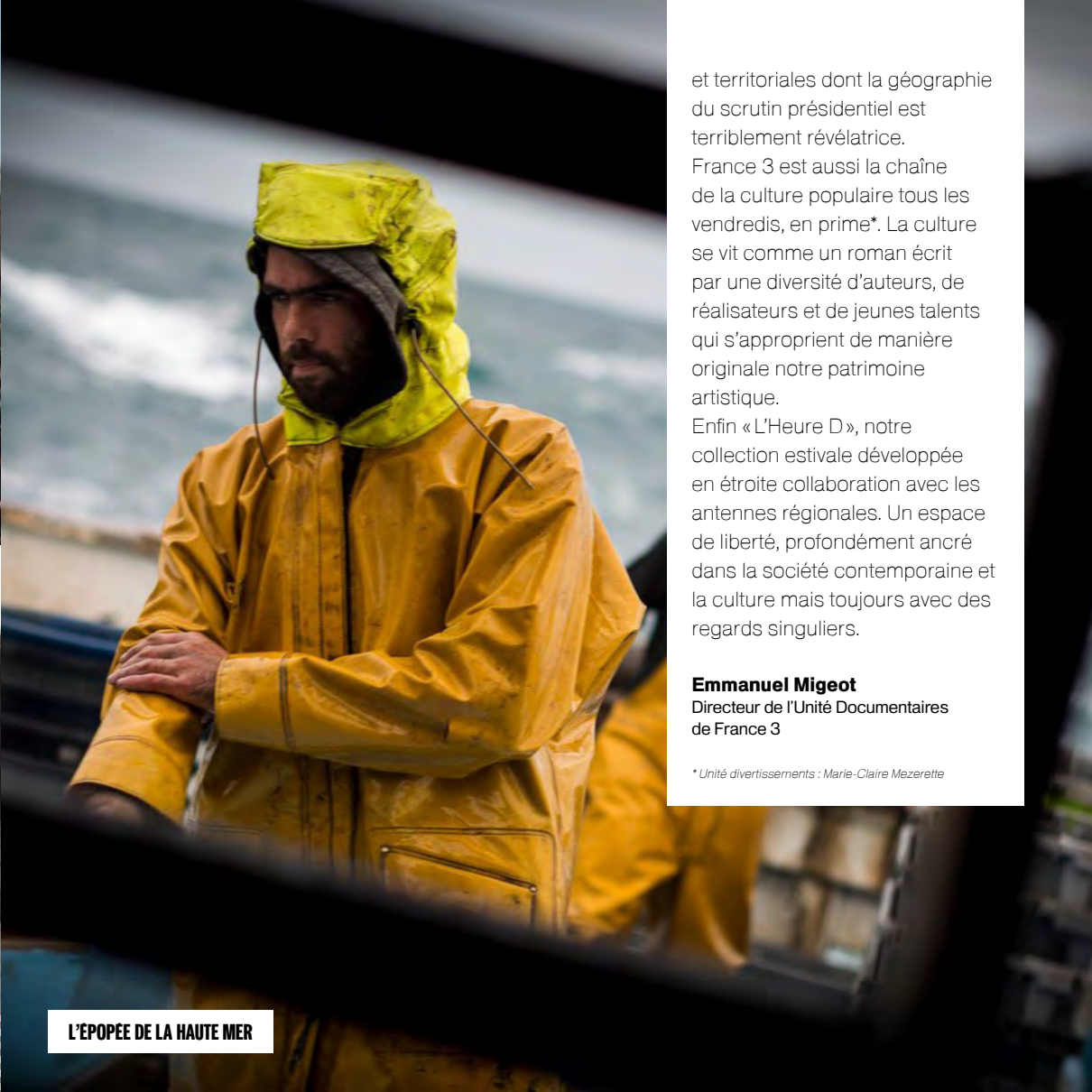
L'EPOPEE DE LA HAUTE MER

et territoriales dont la géographie du scrutin présidentiel est terriblement révélatrice. France 3 est aussi la chaîne de la culture populaire tous les vendredis, en prime*. La culture se vit comme un roman écrit par une diversité d'auteurs, de réalisateurs et de jeunes talents qui s'approprient de manière originale notre patrimoine artistique. Enfin « L'Heure D », notre collection estivale développée en étroite collaboration avec les antennes régionales. Un espace de liberté, profondément ancré dans la société contemporaine et la culture mais toujours avec des regards singuliers.