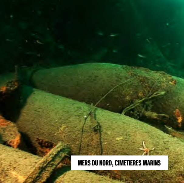
MERS DU NORD, CIMETIERES MARINS