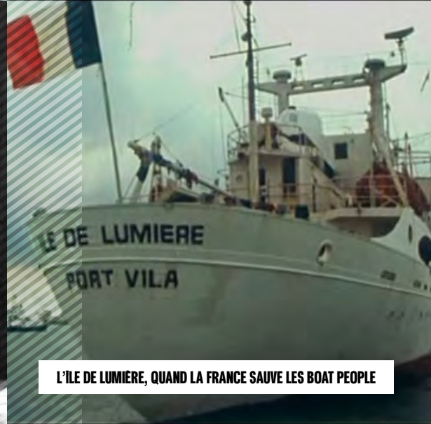
L'ÎLE DE LUMIERE, QUAND LA FRANCE SAUVE LES BOAT PEOPLE