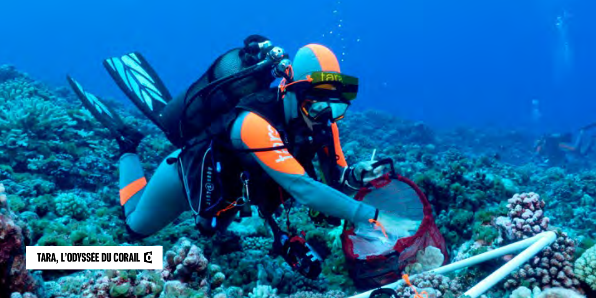
TARA, L'ODYSSEE DU CORAIL