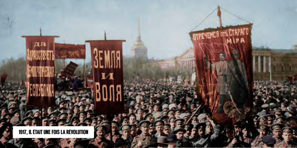
1917, IL ETAIT UNE FOIS LA REVOLUTION