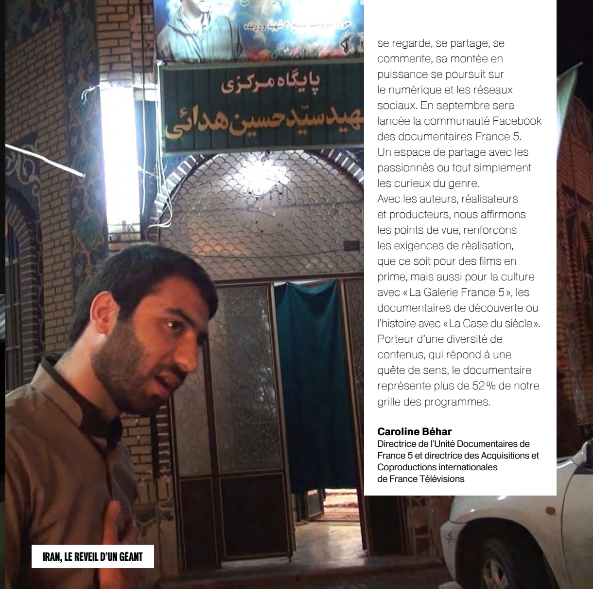
IRAN, LE RÉVEIL D'UN GEANT

se regarde, se partage, se commente, sa montée en puissance se poursuit sur le numérique et les réseaux sociaux. En septembre sera lancée la communauté Facebook des documentaires France 5. Un espace de partage avec les passionnés ou tout simplement les curieux du genre. Avec les auteurs, réalisateurs et producteurs, nous affirmons les points de vue, renforçons les exigences de réalisation, que ce soit pour des films en prime, mais aussi pour la culture avec « La Galerie France 5 », les documentaires de découverte ou l'histoire avec « La Case du siècle ». Porteur d'une diversité de contenus, qui répond à une quête de sens, le documentaire représente plus de 52 % de notre grille des programmes.