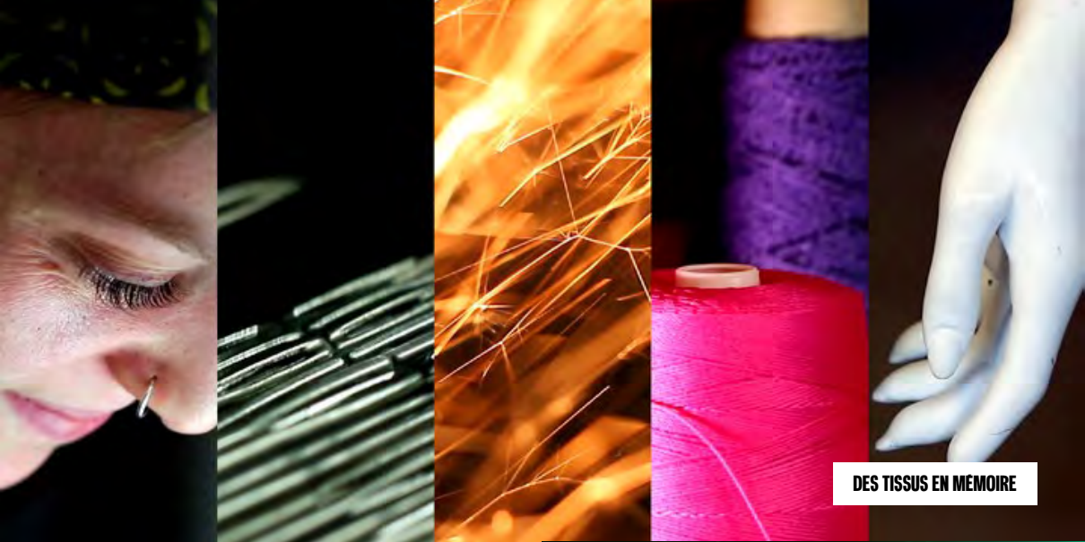
DES TISSUS EN MEMOIRE