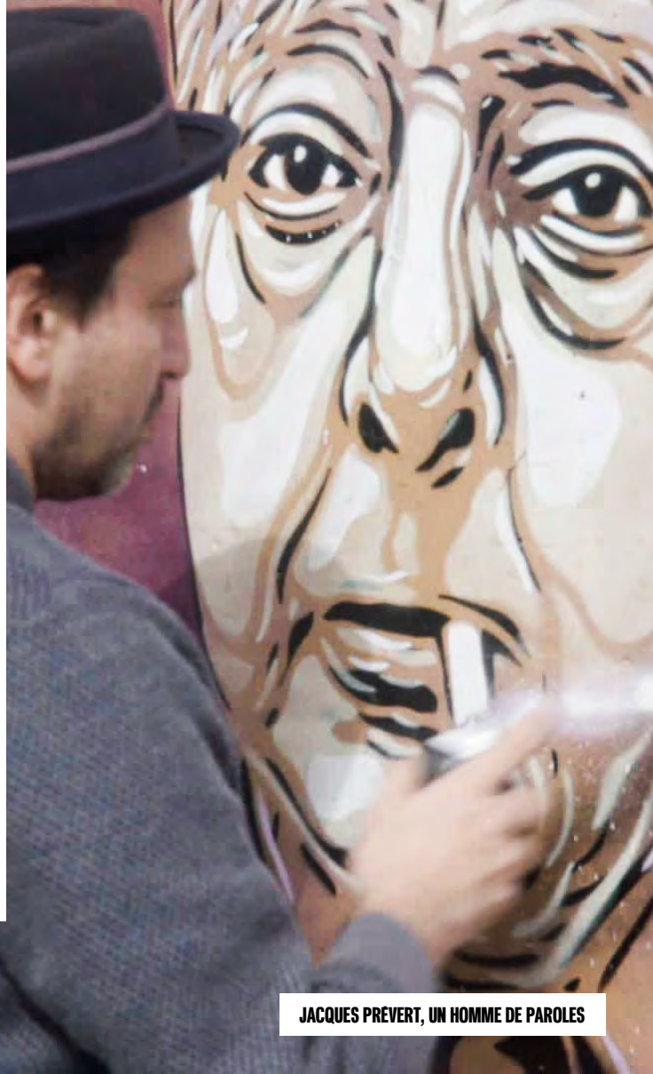
JACQUES PRÉVERT, UN HOMME DE PAROLES

Directrice de l'Unité Documentaires et Magazines culturels de France 2