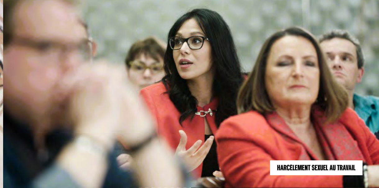
HARCELEMENT SEXUEL AU TRAVAIL