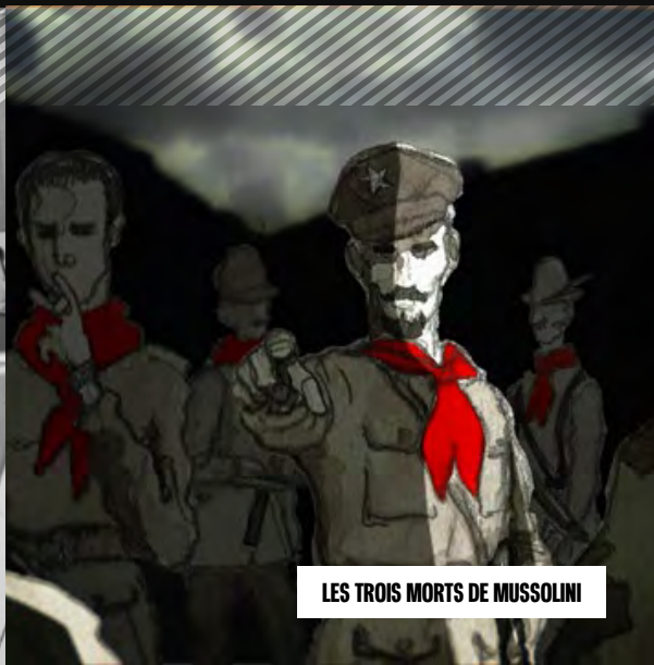
LES TROIS MORTS DE MUSSOLINI