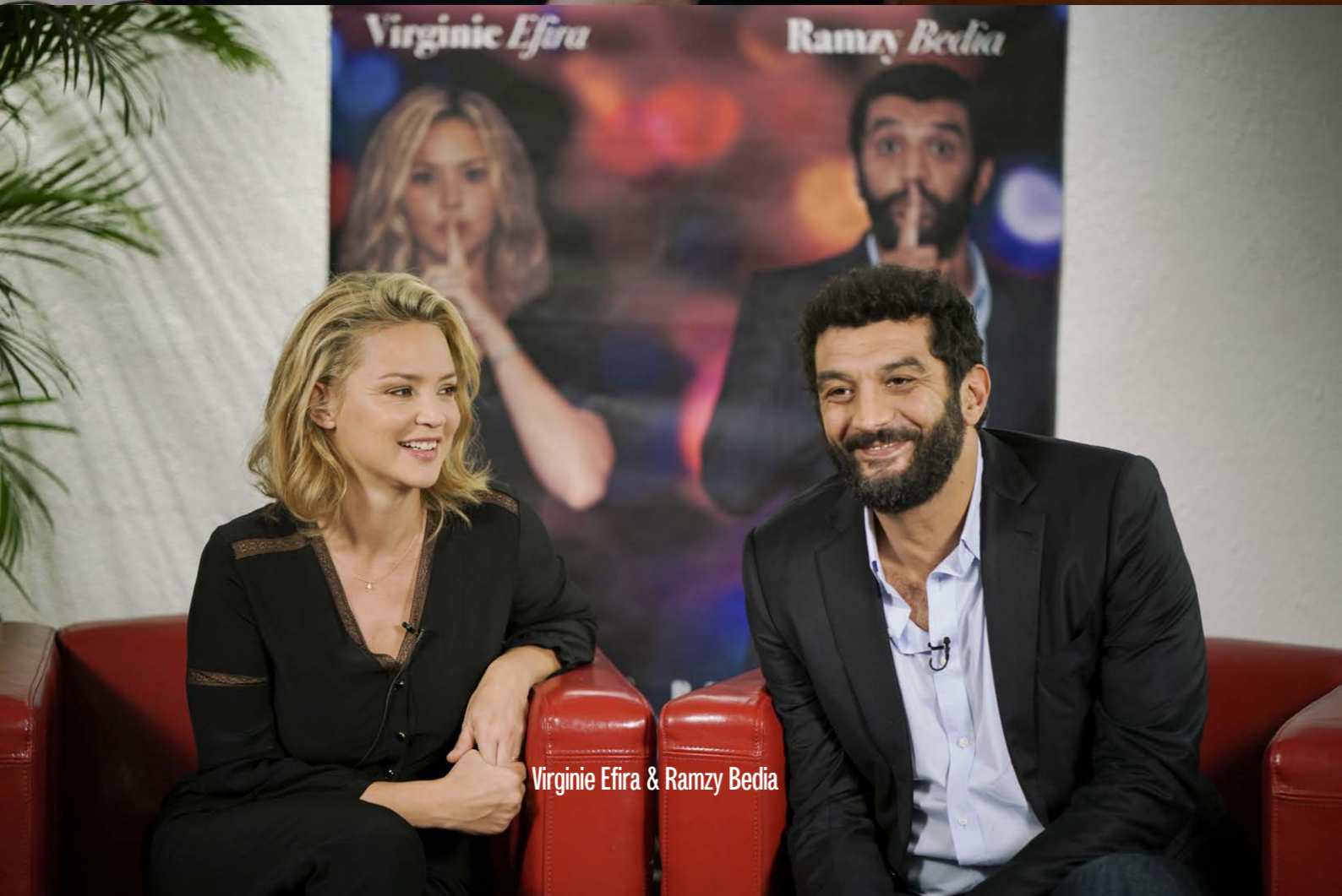
Virginie Efira & Ramzy Bedia