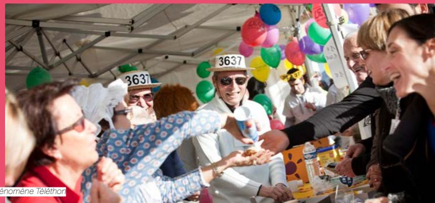
Le Phénomène Téléthon

Témoignages, reportages, annonces scientifiques, variétés...Le meilleur des 30 ans d'émissions a été compilé. Des moments forts, du rire aux larmes, à revivre.