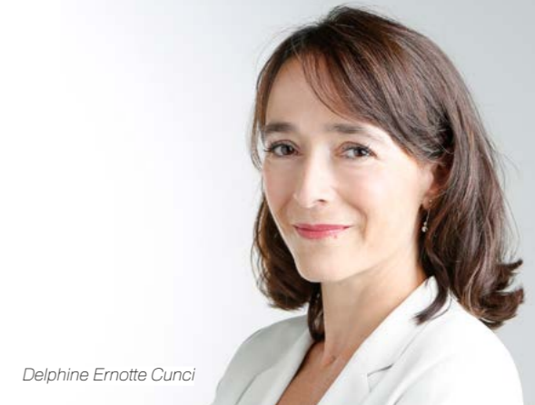
Delphine Ernotte Cunci