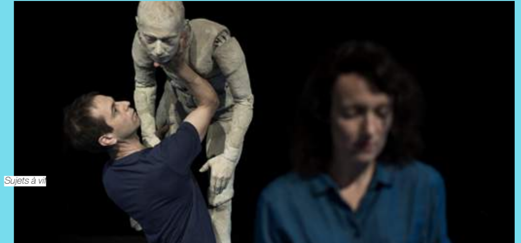
Sujets à vif

France 2 et Culturebox ont retransmis en 2014 l'intégralité de son magnifique Henry VI . Cette année, l'acteur et metteur en scène Thomas Jolly et La Piccola Familia revisitent à leur manière l'histoire du Festival. Sous forme de programmes courts de deux minutes, ils signeront leur « feuilleton » d'Avignon, diffusé sur France 2, France 5 et sur Culturebox.