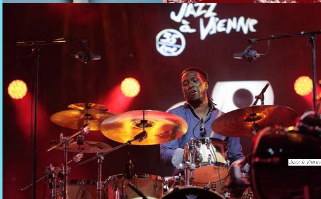
Jazz à Vienne