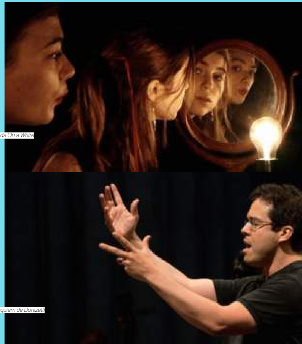
Birds On a Wire