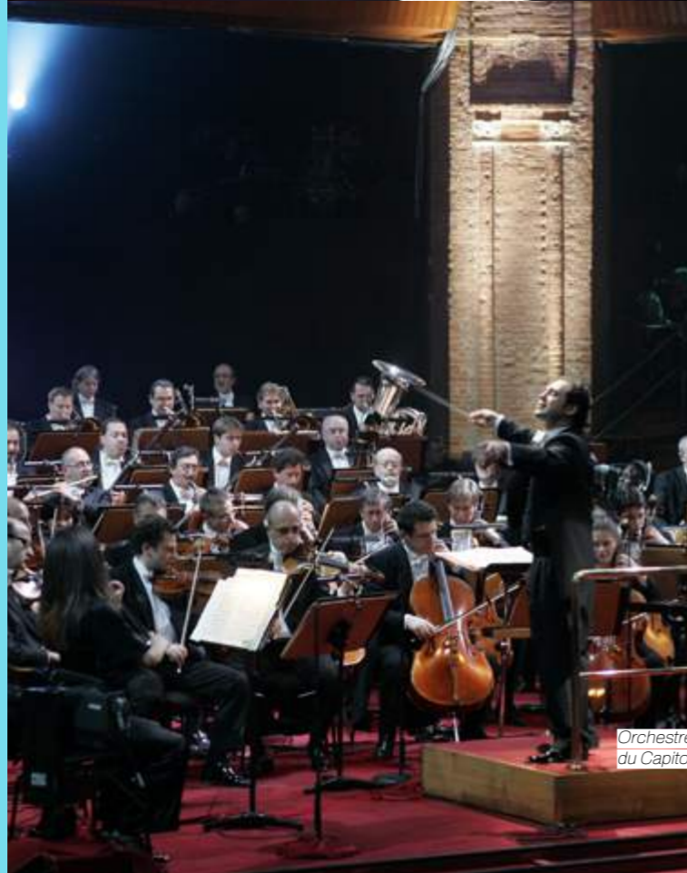
Orchestre National du Capitole