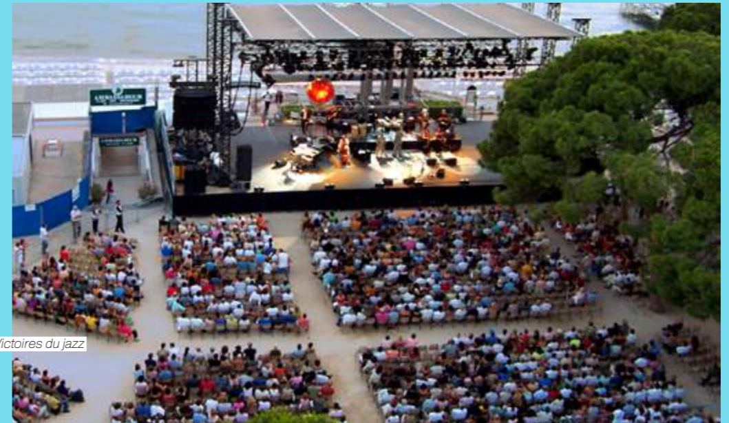
Les Victoires du jazz

Retrouvez le meilleur des festivals de 2015 avec, entre autres, les artistes Cage the Elephant, The Libertines et Stereophonics à Rock en Seine, Super Discount 3, Baxter Dury, Vianney et Julien Doré aux Francofolies, Matthew E White aux Inrocks.