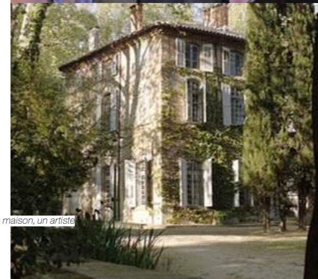
Une maison, un artiste