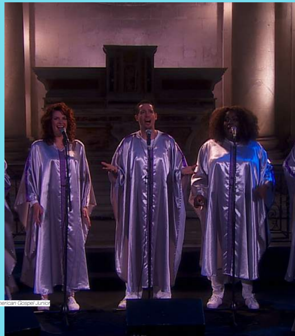
American Gospel Junior

Disponible sur Culturebox et en replay pendant plusieurs mois.