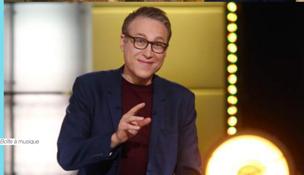
La Boîte à musique