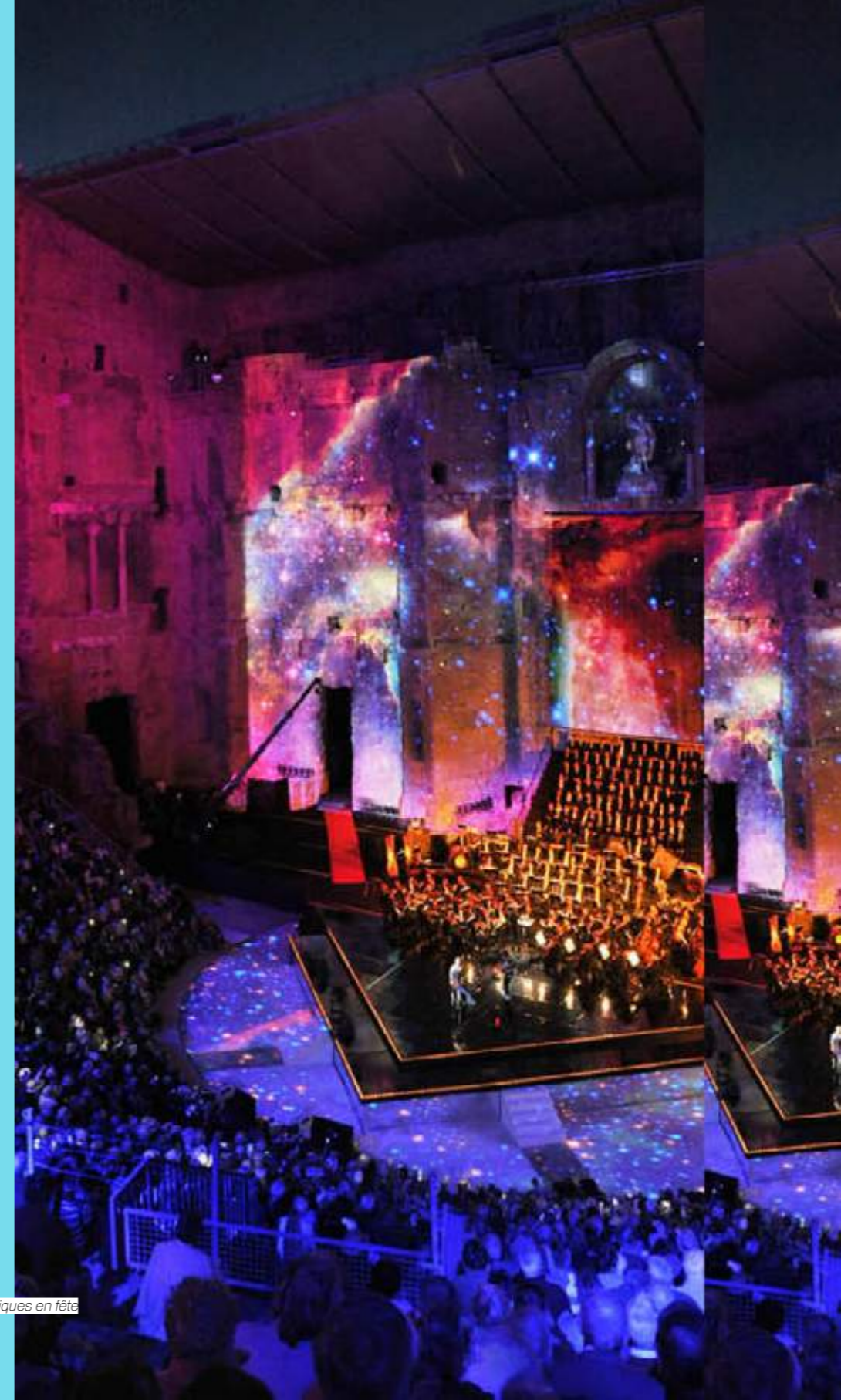
Musiques en fête

Diffusé en simultané sur Culturebox et en replay durant plusieurs mois.