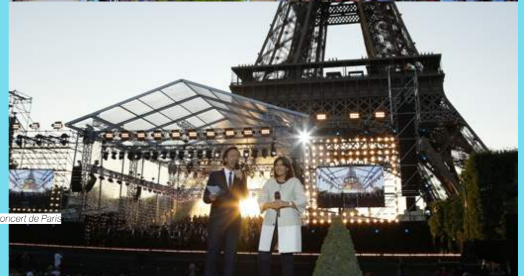
Concert de Paris