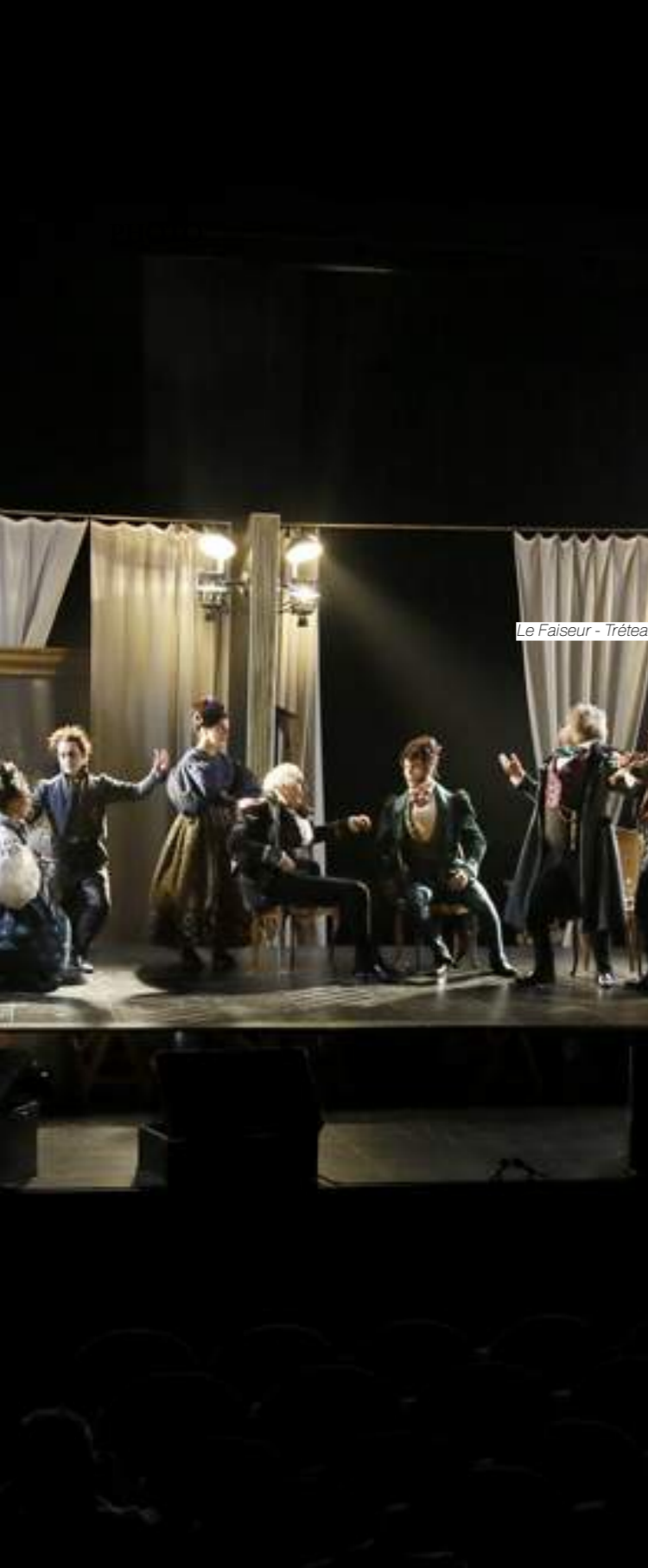
Le Faiseur - Tréteaux de France

Découvrez l'actualité du spectacle vivant 7j/7.