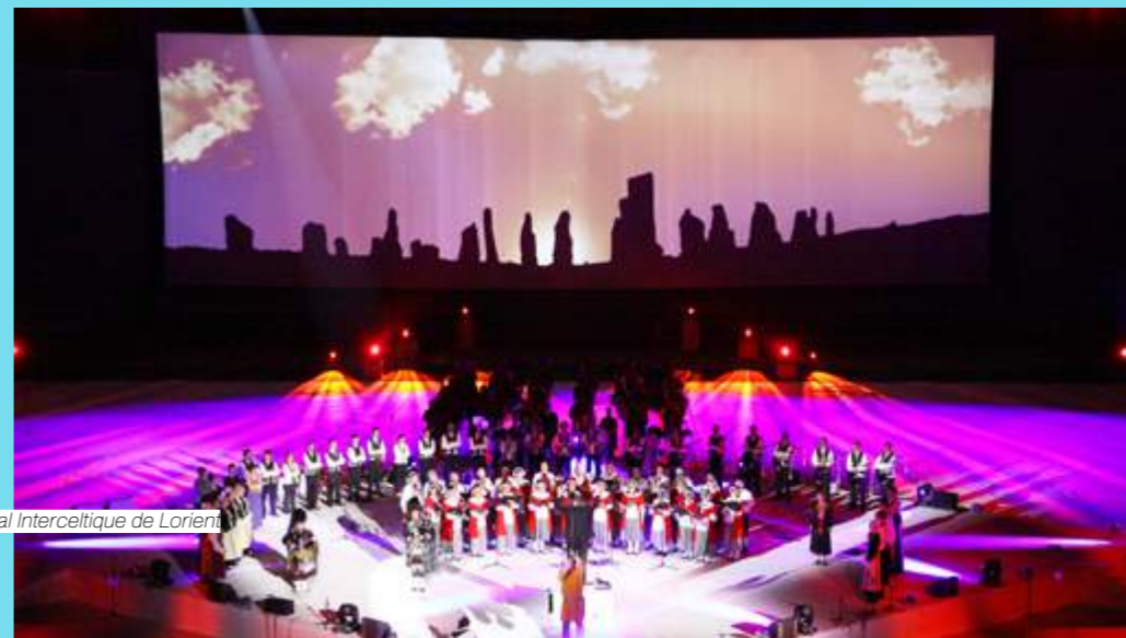
Festival Interceltique de Lorient

En Polynésie, la fête est un art de vivre et elle porte un nom : la bringue. Si la bringue est souvent improvisée, elle est toujours maîtrisée. On sort un ukulélé, une guitare, un kamaka, quelques cuillères pour soutenir le rythme, et c'est parti pour des heures de chansons ! Pour mettre en valeur ce savoir-faire unique, la mairie de Faa'a organise un grand concours populaire que Polynésie 1 ère relaie sur ses antennes. Les deux matinées de présélection des groupes, les 16 et 17 juin, ainsi que la finale, le 18 juin, seront diffusées en direct en radio ainsi que sur www.polynesie1ere.fr