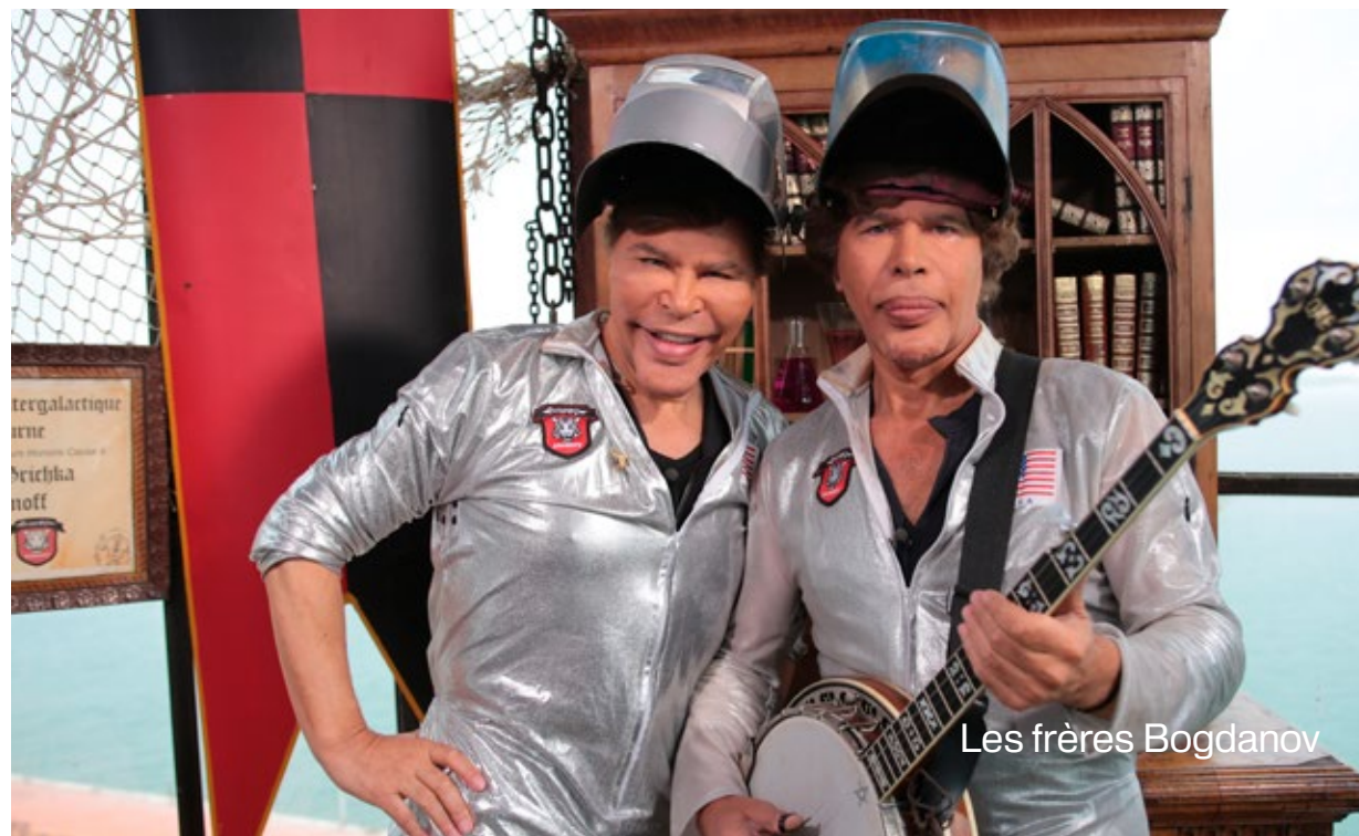
Les frères Bogdanov