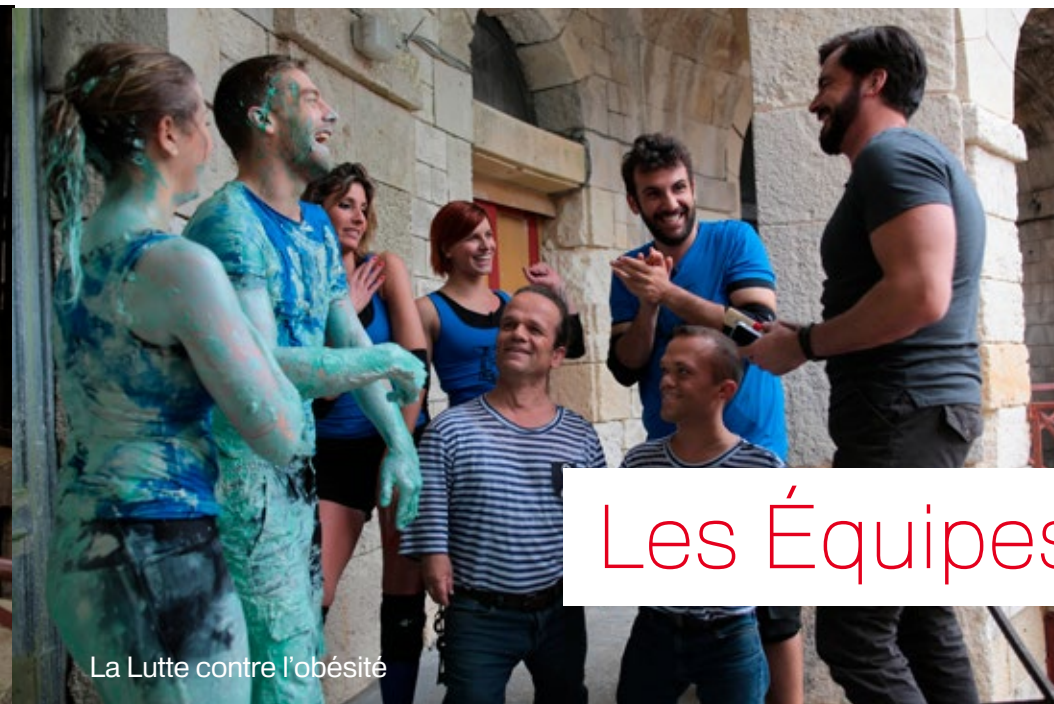
La Lutte contre l'obésité