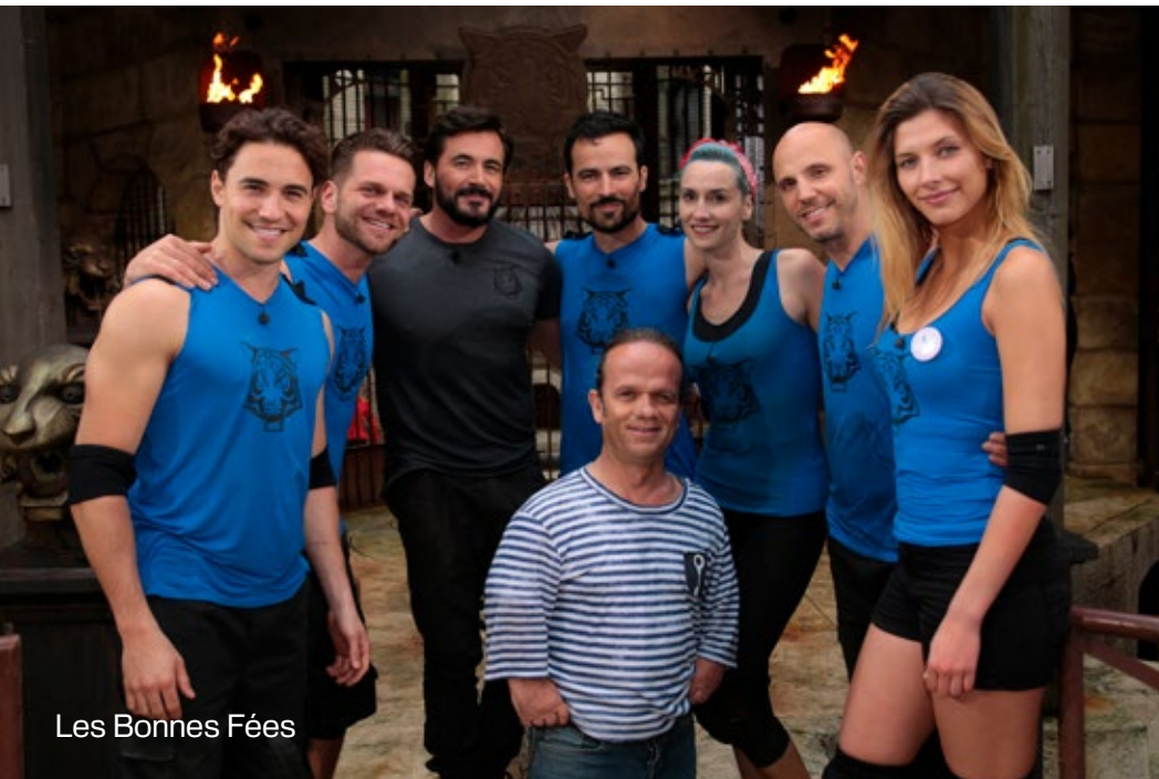
Les Bonnes Fées