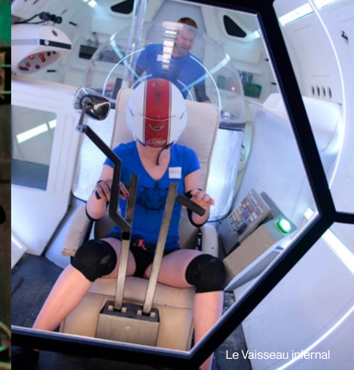
Le Vaisseau infernal