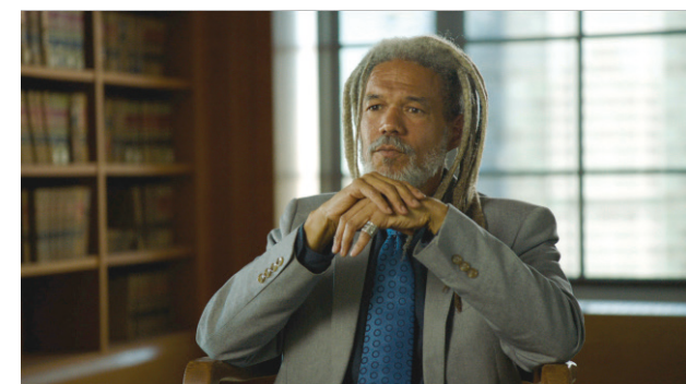
Vincent Brown : Historien, professeur à l'Université de Harvard, Cambridge. Spécialiste de l'histoire atlantique de l'esclavage et de la diaspora africaine.

« Tous les ports atlantiques en fait irriguent un arrière-pays qui va très loin, parce que pour Nantes, ça va jusqu'à Orléans, par exemple, c'est-à-dire ça remonte tous les fleuves. Donc, l'esclavage produit de la richesse qui est une richesse essentielle pour la France. »