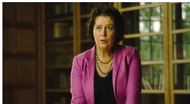
Myriam Cottias : Historienne, directrice de recherche au CNRS. Spécialiste de l'histoire sociale des Caraïbes.

« 74% des esclaves déportés l'ont été à cause du sucre. Pour bien comprendre le commerce des esclaves, il suffit de connaître l'histoire du sucre. »