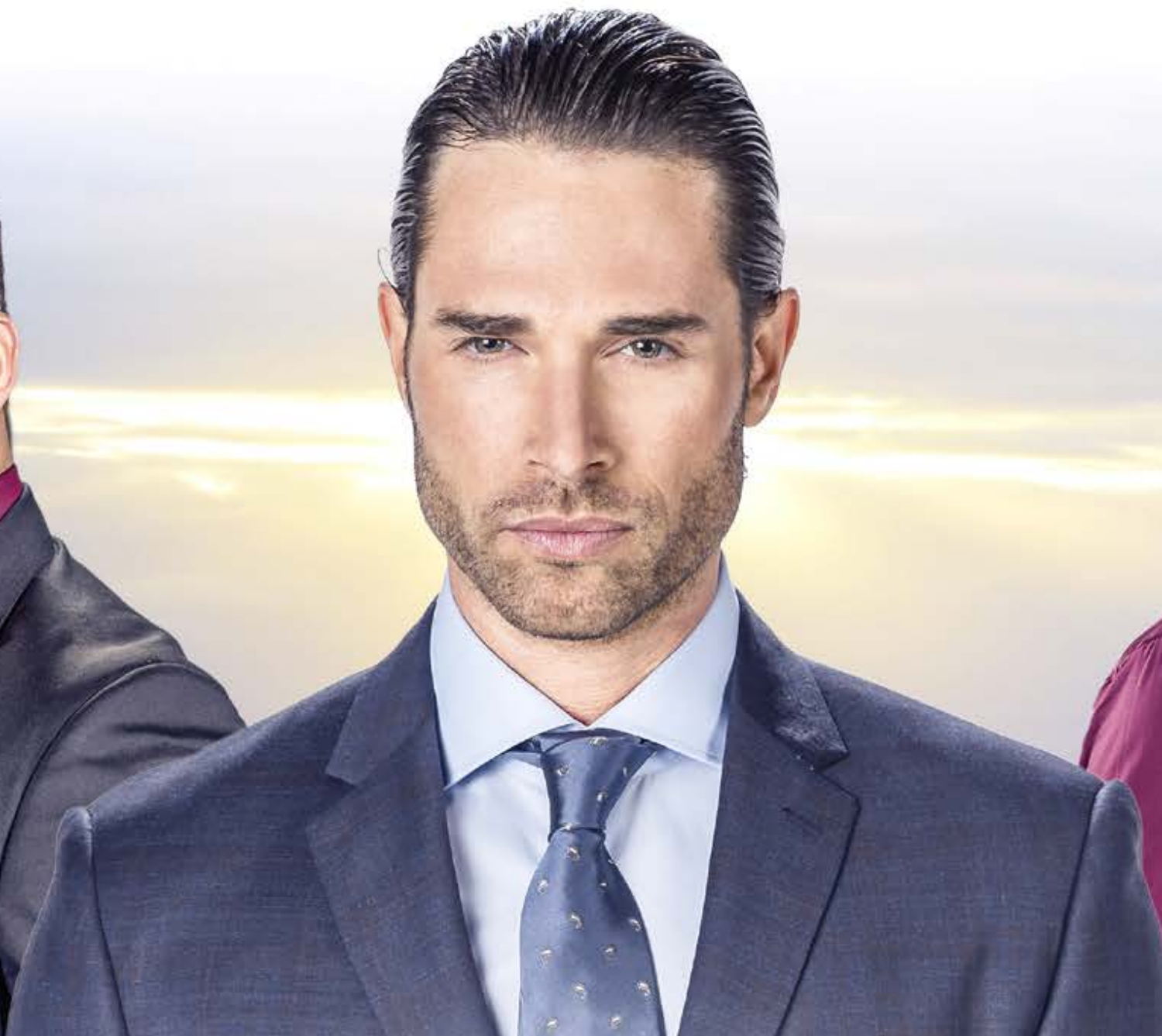
MARCELO / SANTIAGO Sebastián Rulli

C'est un homme ambitieux et sans scrupules. Il méprise Javier, son frère, et Tadeo, son père. Il exècre la pauvreté et brûle de quitter son modeste milieu. Il a commencé à travailler pour l'agence immobilière de Mariano et y a rencontré Ana Leticia. Immédiatement attiré par la jeune femme, il tente de la séduire, mais elle repousse ses avances. Lorsqu'il apprend qu'elle est associée à une affaire criminelle, il la fait chanter pour obtenir ses faveurs. Il devient bientôt son amant... et son complice.