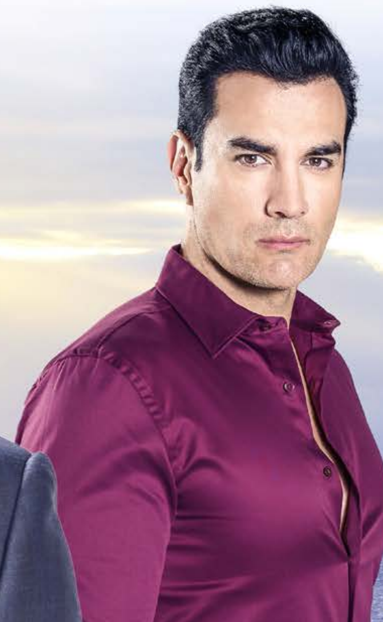
RAMIRO David Zepeda