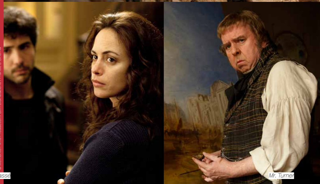
© Memento Films Production / Bim Distribution / France 3 Cinéma Le Passé