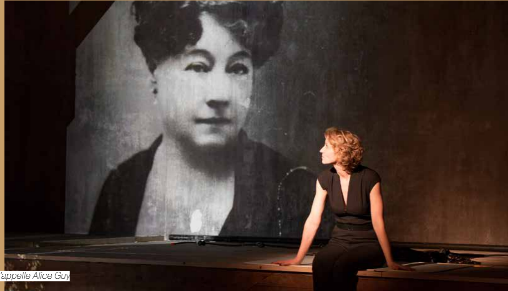
Elle s'appelle Alice Guy