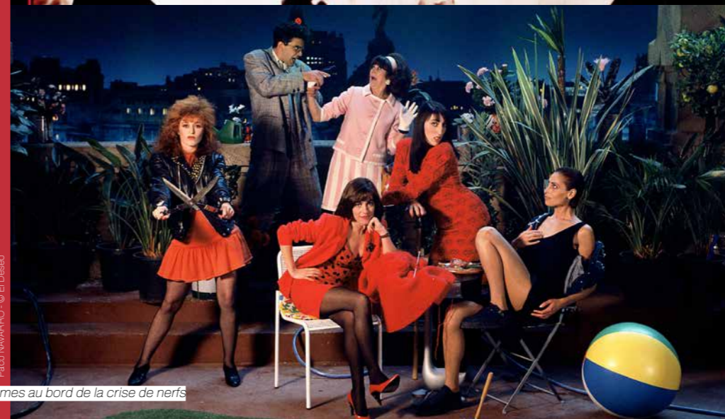
Femmes au bord de la crise de nerfs