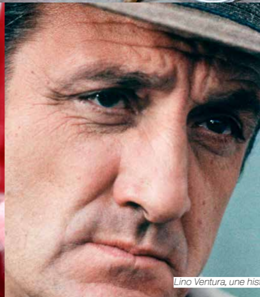
Lino Ventura, une histoire d'homme