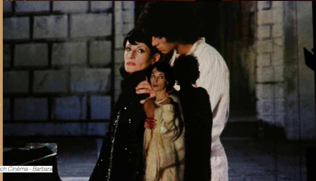
© Waiting For Cinema 2017 / Roger Arpaio/ina Le Pitch Cinéma - Barbara