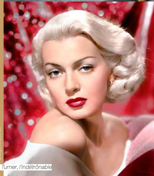
Lana Turner, l'indétrônable