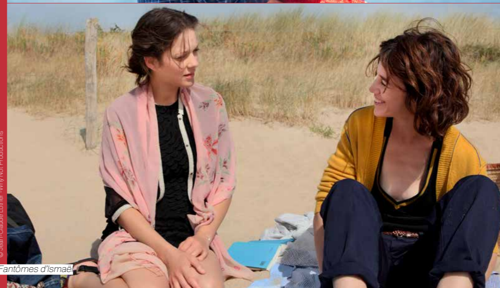
Les Fantômes d'Ismaël