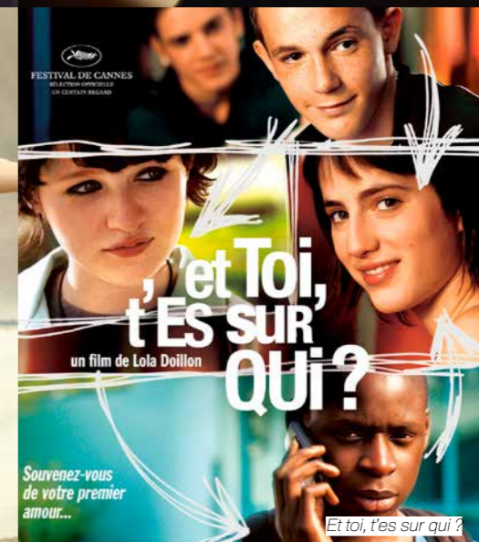
Et toi, t'es sur qui ?