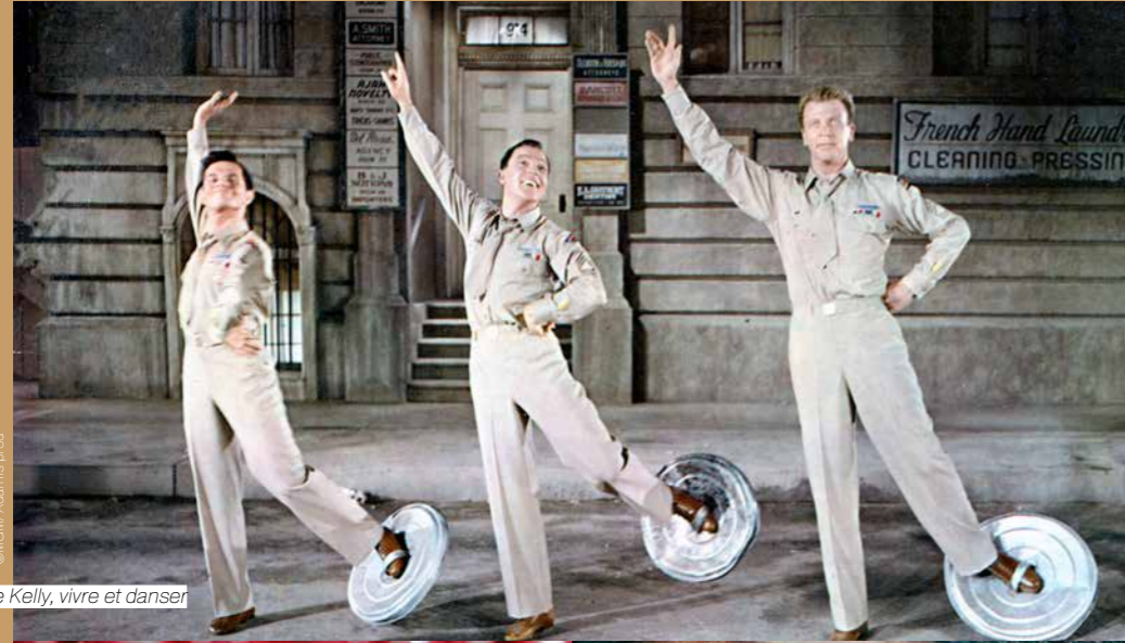
Gene Kelly, vivre et danser