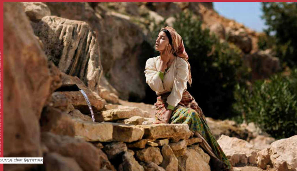
La Source des femmes

Le film a été présenté au Festival de Cannes 2014 et a obtenu le prix d'interprétation masculine pour Timothy Spall.