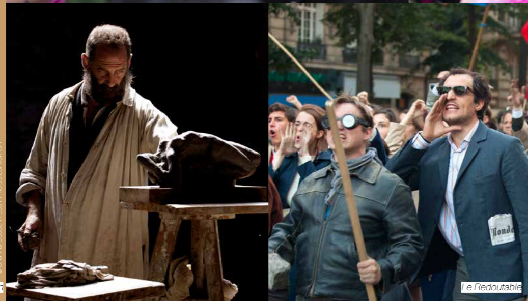
© Shanna Besson / Les Films du Lendemain Rodin