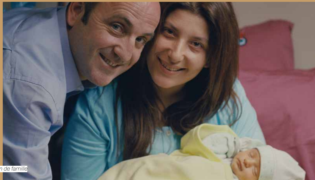
Album de famille