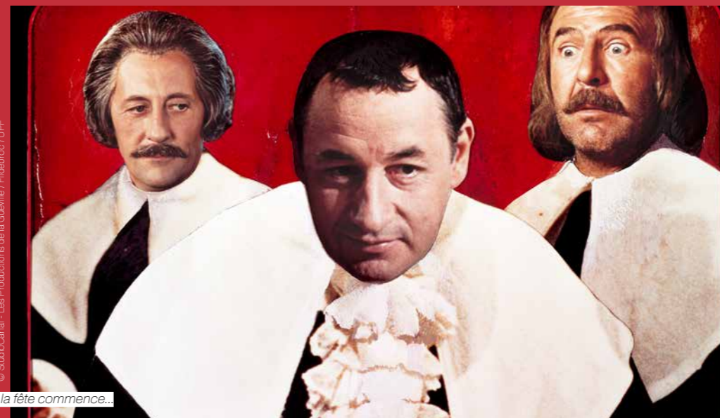
Que la fête commence...

Actrice de doublage, Pepa vient de se faire plaquer par son amant et collègue Iván. Pour aider une amie mannequin liée à un terroriste chiite recherché par la police, elle fait appel à une avocate, qui se révèle être la maîtresse de son ex-amant... Adaptant librement une pièce de Jean Cocteau, Pedro Almodóvar signe une comédie rocambolesque sur la condition féminine dans l'Espagne post-franquiste. Premier succès international du réalisateur espagnol, lauréat de cinq goyas en Espagne, Femmes au bord de la crise de nerfs est autant un vaudeville moderne qu'une passionnante réflexion sur la nature même du cinéma.