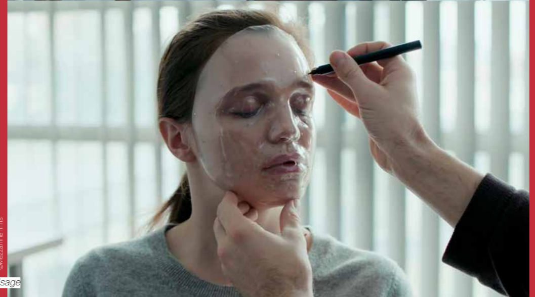
Les enfants partent à l'aube