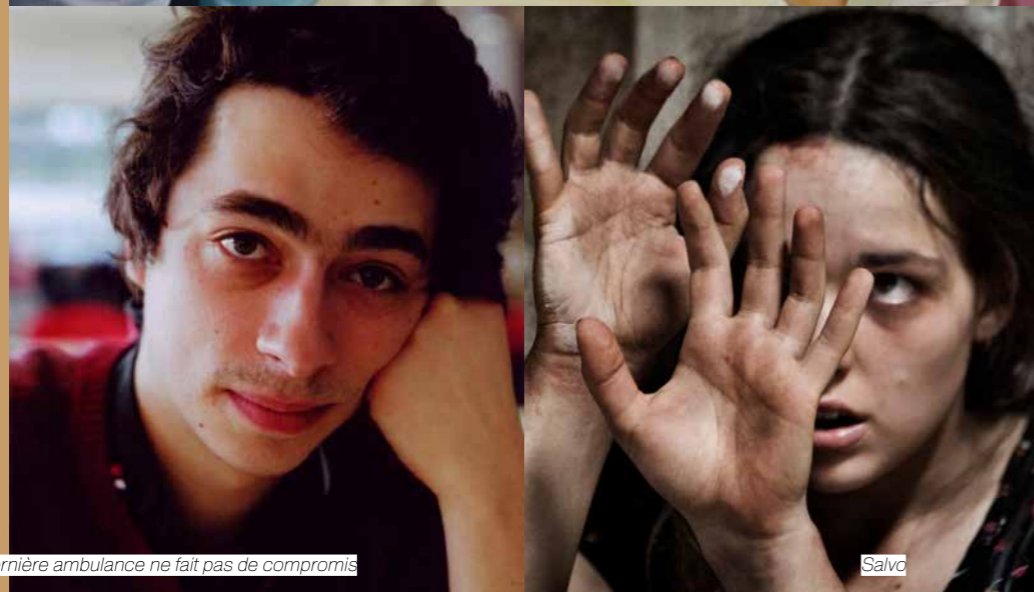
La dernière ambulance ne fait pas de compromis