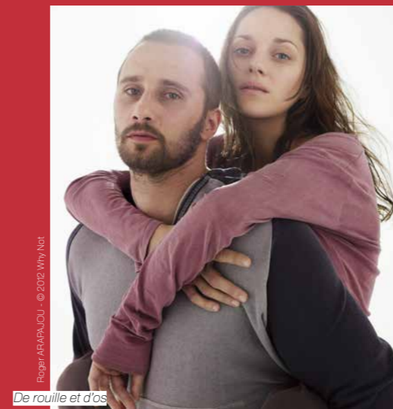
De rouille et d'os