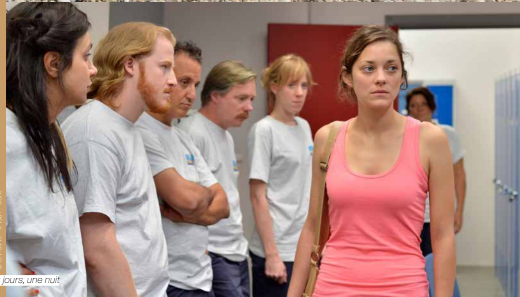
Deux jours, une nuit