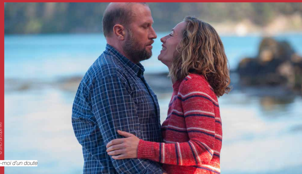
Ôtez-moi d'un doute